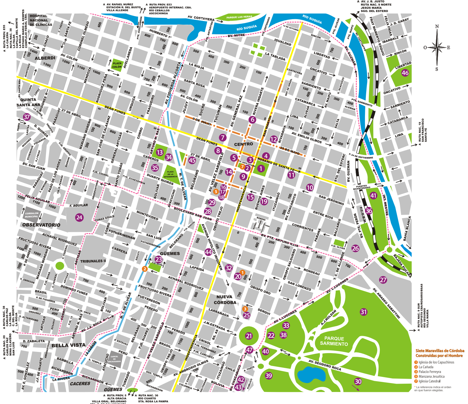
Siete Maravillas de Córdoba Construidas por el Hombre 1 Iglesia de los Capuchinos 2 La Cañada 3 Palacio Ferreyra 4 Manzana Jesuítica 5 Iglesia Catedral 6 La referencia indica el orden en que fueron elegidas.